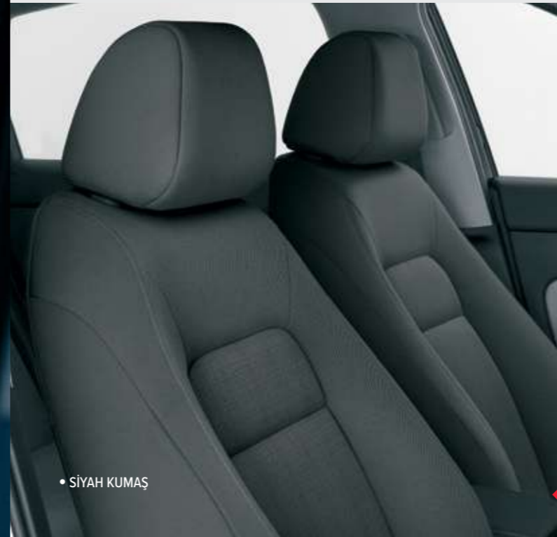
• SİYAH KUMAŞ