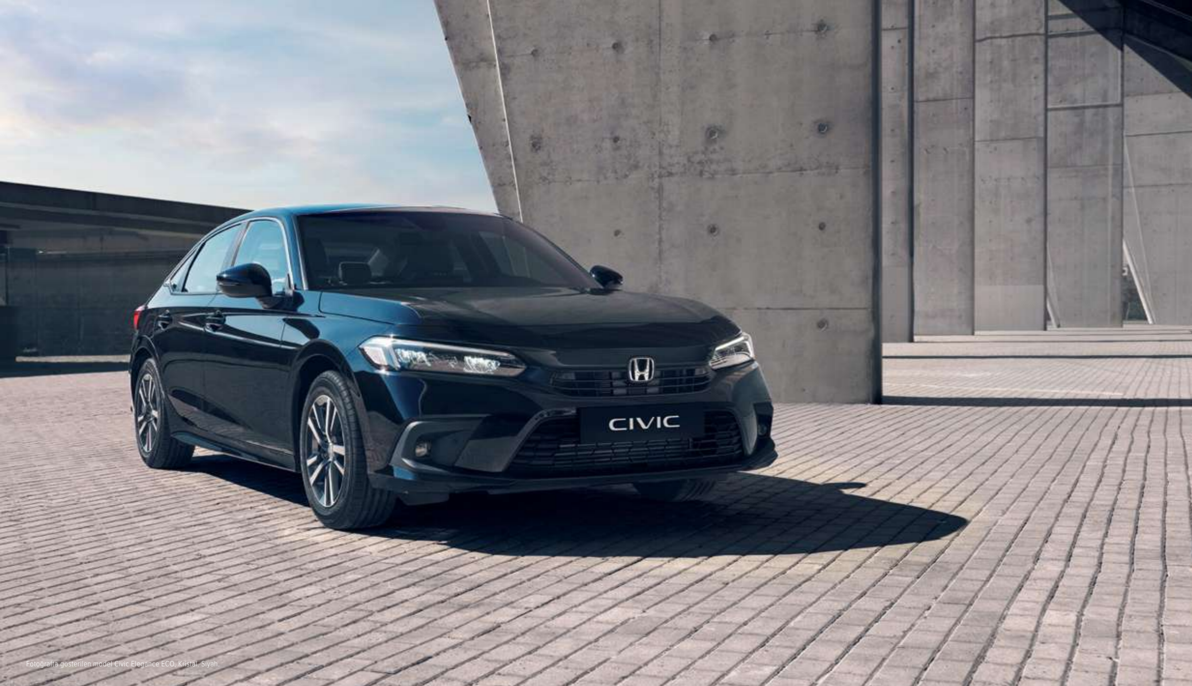
Fotografya gösterilen model Civic Elegance ECO, Kristal, Siyah.