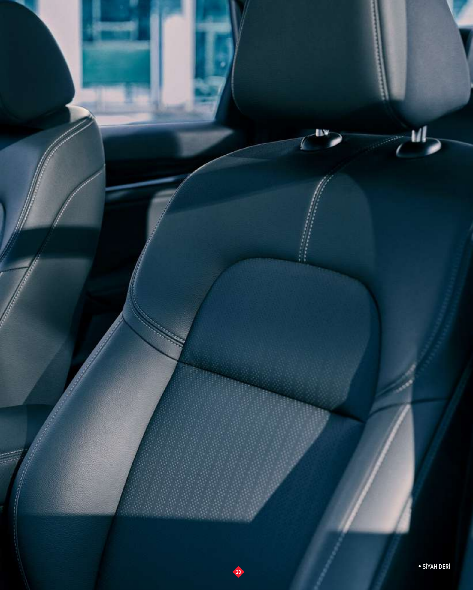
• SİYAH DERİ

*Gri/bej iç döşeme seçeneği sadece Kristal Siyah dış renk ile sunulmaktadır.